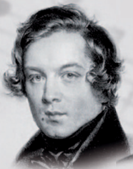
200 Jahre Robert Schumann