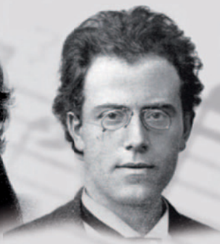
150 Jahre Gustav Mahler

Jahrespreise für CD-Editionen mit Werken der Jahrhundertjubilare Frédéric Chopin • Robert Schumann • Gustav Mahler