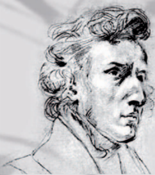
200 Jahre Frédéric Chopin

PREIS DER DEUTSCHEN SCHALLPLATTEN KRITIK