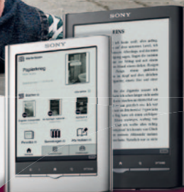
Pocket Edition™ Touch Edition™

lesen.net eBooks | eReader | eCommerce Sony Reader PRS-650 Touch Edition sehr gut (1,5)